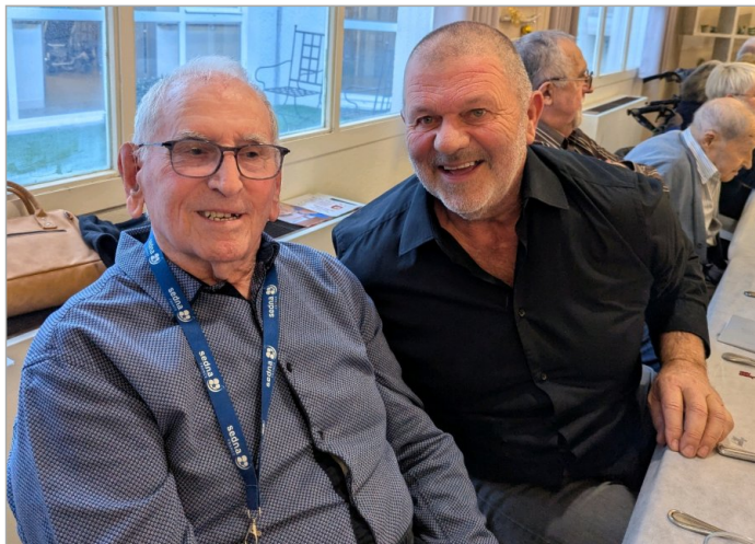
Mr S. entouré de sa famille