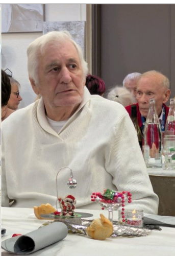
Quelques photos volées entre 2 plats...