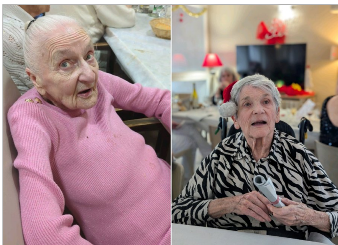
Que de beaux souvenirs avec ces jolis clichés