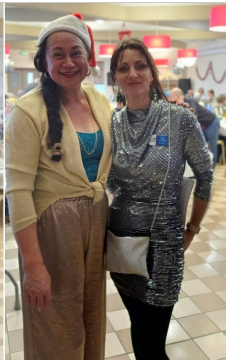
la direction et les équipes de la Deymarde en mode NOEL DISCO