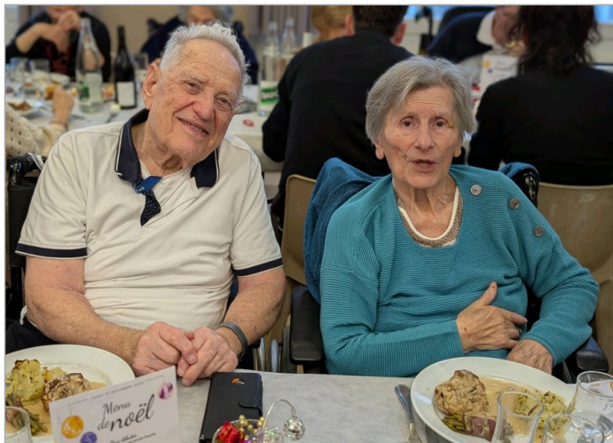
Mr et Mme B. avaient 6 invités aujourd'hui