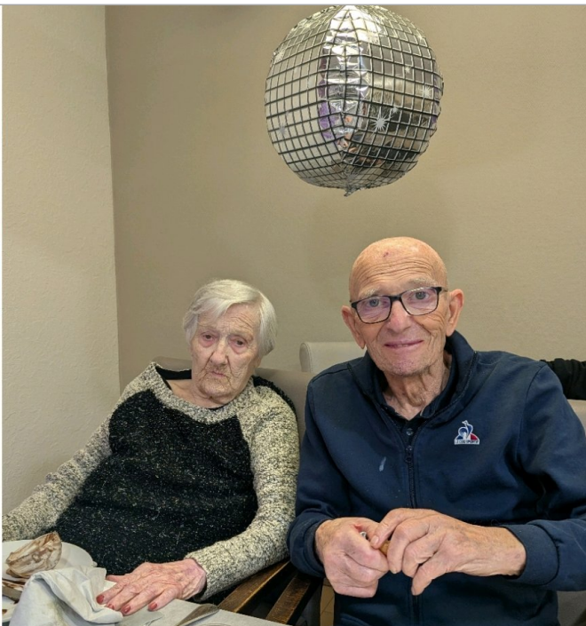
Un repas convivial sous les boules à facettes ;-)